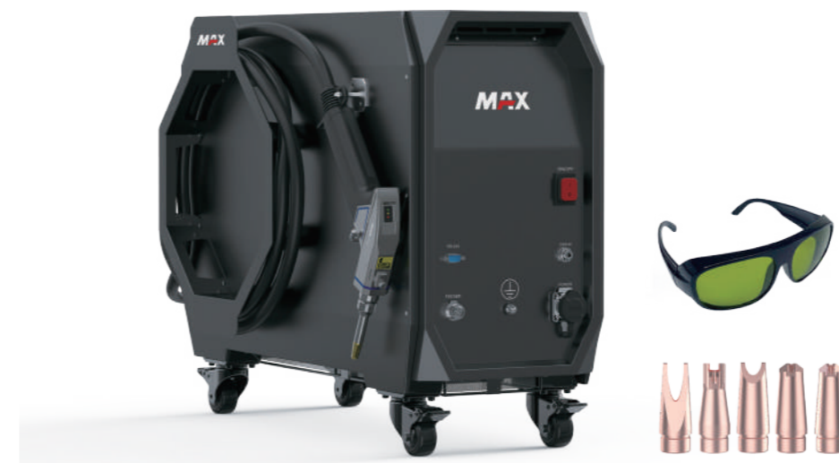
S 5 različnimi bakrenimi šobami