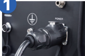
1. Napajanje 220 V