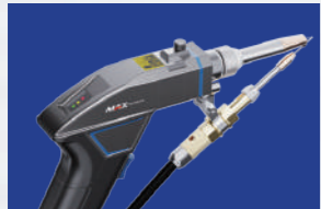
Gorilnik s podajalnikom žice

S kolimacijskim vmesnikom QCS smo znatno zmanjšali velikost in težo gorilnika, tako da le ta znaša samo 680 gramov. Optična konfiguracija zagotavlja visoko zmogljivost in majhno izgubo energije. Gorilnik je ergonomično oblikovan in ima vgrajeno funkcijo nihanja (Wobbling). Opremljen je z dvema varnostnima stikaloma, ki upravljavcu omogočata varno uporabo za kakovostno celodnevno varjenje.