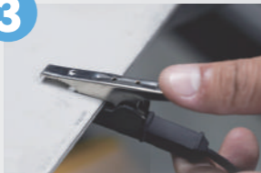
3. Masa klešče - varnostni krog