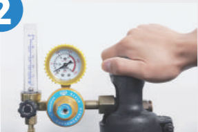
2. Plin: argon/dušik